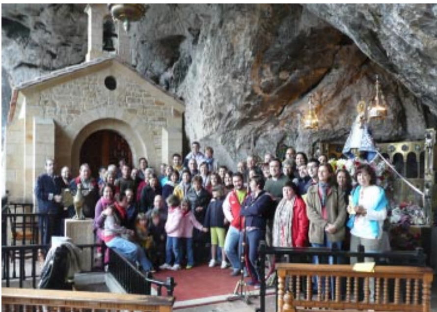
Seglares participantes en la Asamblea.