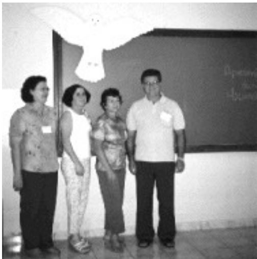
Nuevo Consejo Regional de Brasil-Paraguay