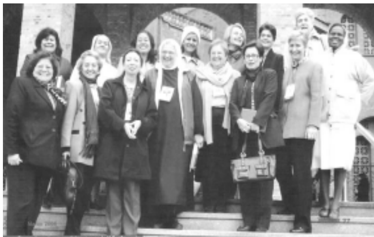
Mujeres participantes en Aparecida.

Antropológicamente, el ser humano es un ente social que interactúa e influye de manera constante unos con otros, es así que todas las personas tienen de alguna manera la misión de humanizarse, en un proceso evolutivo que cada quien, de manera individual o colectiva, va descubriendo por Voluntad Divina, y que solo se logra en la práctica de la justicia, marcando así la conciencia personal y comunitaria. Esto implica que el ser humano es capaz de responder por sí mismo y por los demás, en el que siempre debe primar la vida sobre la muerte. (1) Desde este punto de vista, la Misión Compartida tiene su origen con la misma humanidad.